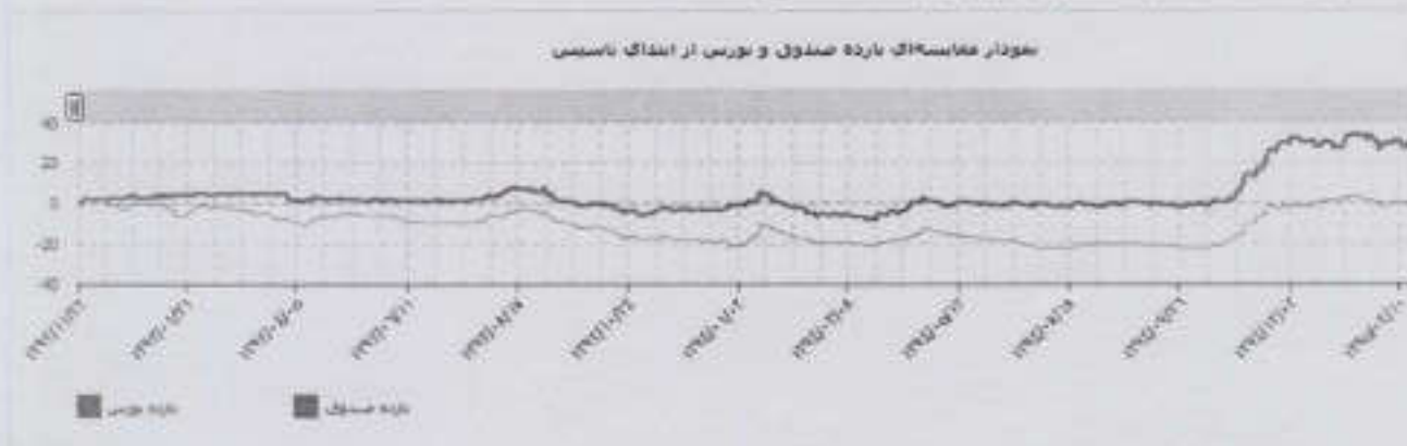
۸-۱ نمودار مقایسه ای بازده صندوق و بورس از ابتدای تاسیس: