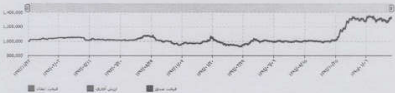
قیمت ابطال و ارزش آماری هر واحد سرمایه‌گذاری (ریال)

باتشکر مدیر صندوق تمارتی سرمایه گذاری شرکت رشدگان شماره ثبت: ۳۳۳۷۲